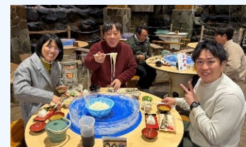
⑨平成の名水百選 京田湧水 (唐船峡 そうめん流し)