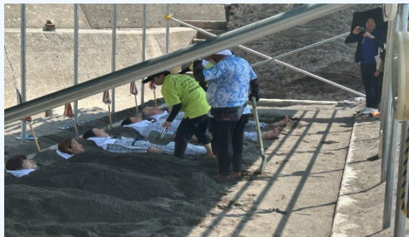
④山川砂蒸し温泉 砂湯里 (疲れた体を癒してもらう)