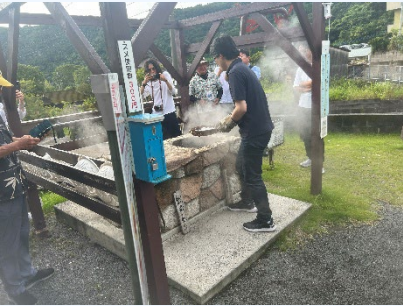
④スメ体験 (収穫野菜の試食)