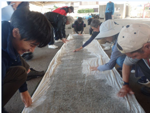
②アマモマット作成