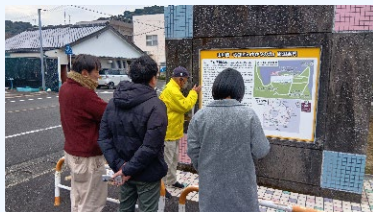
③山川まち歩き (山川の歴史～港について)