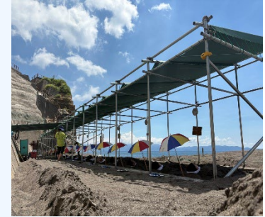
⑦山川砂蒸し温泉 砂湯里 (疲れた体を癒してもらう)