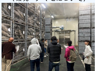
⑧カツオ水揚げ冷凍庫見学