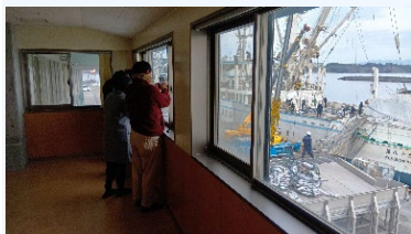
①カツオの水揚げ 冷蔵庫体験