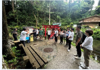
②平成の名水百選 京田湧水 (唐船峡 そうめん流し)