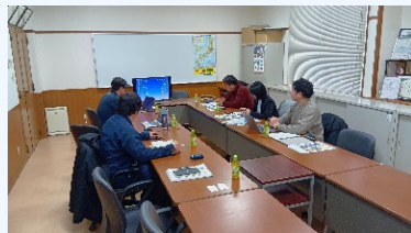
④座学 (環境・アマモについて)