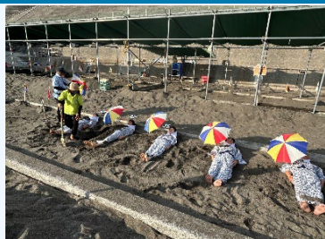
⑤山川砂蒸し温泉 砂湯里 (疲れた体を癒してもらう)