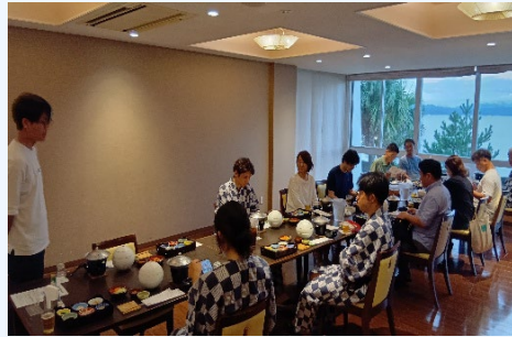
⑤共生サイトで取れた魚の提供 (サイト内のカンパチを使った刺身等)