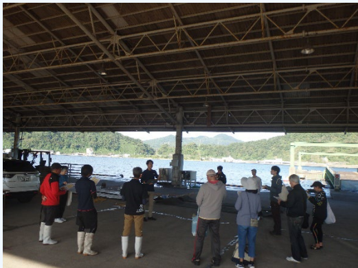
①座学 (環境問題・アマモについて知ってもらう)