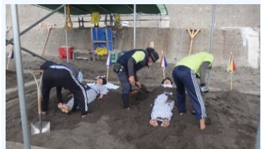
⑥砂蒸し温泉 砂湯里