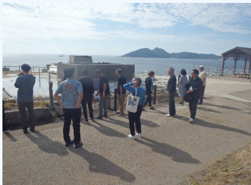
⑤たまたげ温泉・山川製塩工場跡氏視察