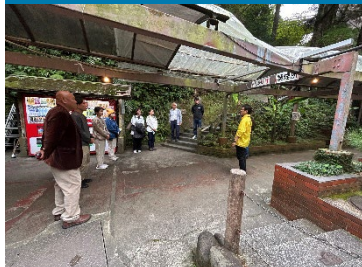
①平成の名水百選 京田湧水