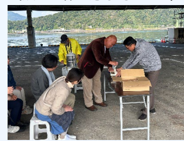
⑩鰹節削り・茶節体験