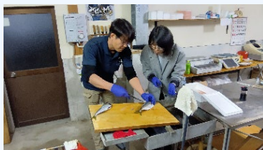
⑦地元漁師との交流 (カツオのタタキ・サイト内で漁獲された魚の調理体験)