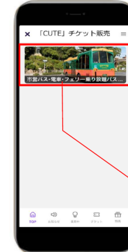
(アプリ画面：チケットTOP)

・期限内で複数回使用できる「有効期間」を設定できるタイプのチケット ・1度きりの使用を想定した「もぎりタイプのチケット」の2種類を販売することができます。