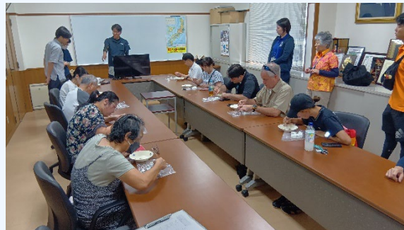
②漁協会議室にてアマモの種子の選別 (紙粘土に種子を植える)