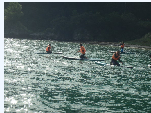
③アマモの種まき・SUP体験 (SUPでアマモ場に行き種をまく)