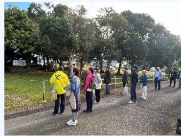
⑦山川まち歩き 山川の歴史～港について (←カツオのタタキ・サイト内で漁獲された鯖の天ぷら調理体験)