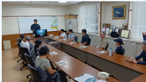
①漁協会議室にて座学 (環境問題・アマモについて知ってもらう)

令和7年8月28日実施 いぶすき観光デザインHPより募集7名・鹿児島大学先生2名 合計9名