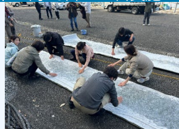
③座学・アマモマット作成 (環境・アマモについて)