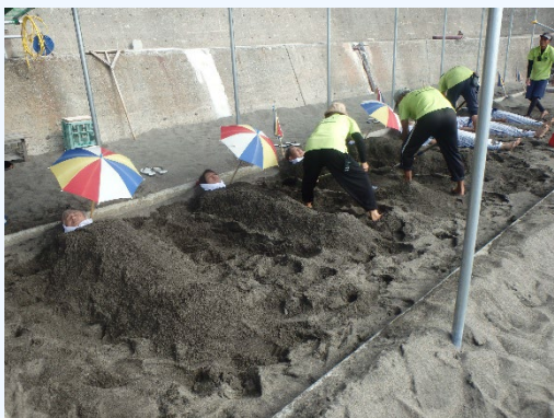
④山川砂蒸し温泉 砂湯里 (疲れた体を癒してもらう)