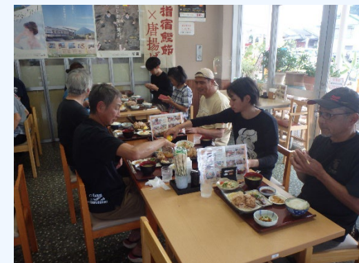
⑥昼食 道の駅活お海道