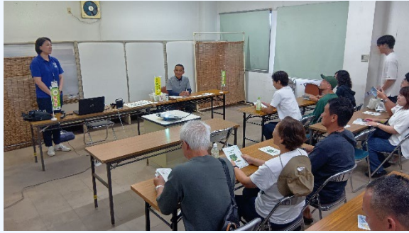
①IPM農業体験・野菜収穫 (環境に配慮した農業を知ってもらう)