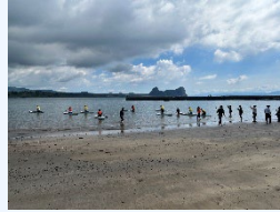
⑥座学・アマモの種子選別 (種まき・SUP体験)