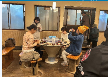
②唐船峡 そうめん流し