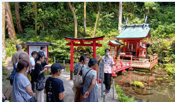
⑤平成の名水百選 京田湧水