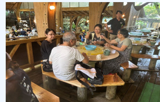
⑥唐船峡 そうめん流し (本枯れ節を使用しためんつゆ使用)