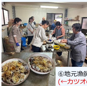
⑥地元漁師との交流