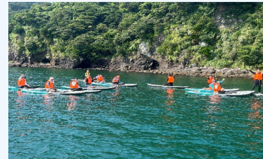
③アマモの種まき・SUP体験 (SUPでアマモ場に行き種をまく)