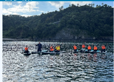
④アマモの種まき・SUP体験