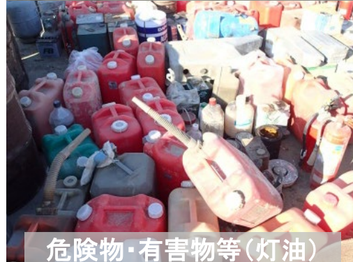
危険物・有害物等(灯油)