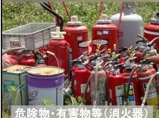
危険物・有害物等(消火器)