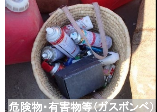
危険物・有害物等(ガスボンベ)