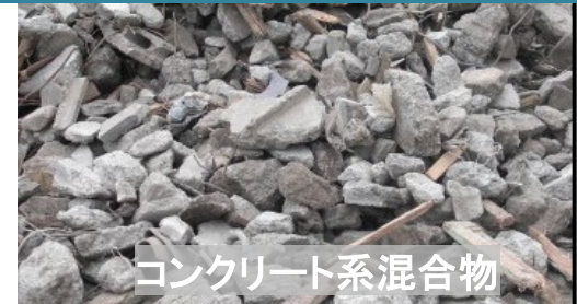
コンクリート系混合物