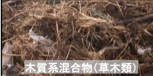
木質系混合物(草木類)