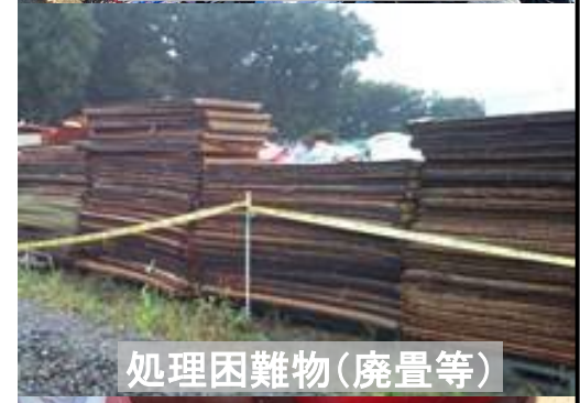
処理困難物(廃畳等)