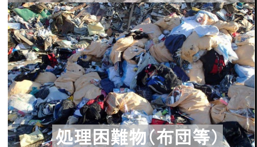
処理困難物(布団等)