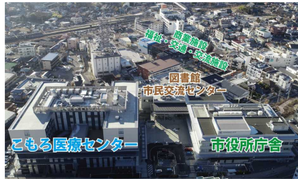
市役所、病院等の集約 病院、図書館、市民交流センター、商業施設などを市役所庁舎周辺に集約し、併せて周辺の歩行空間を整備することにより市民の利便性を向上