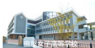
鹿屋女子高等学校