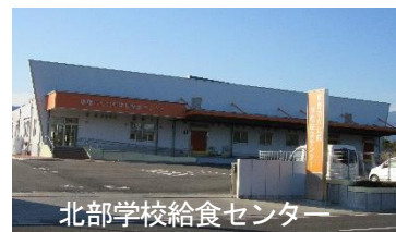
北部学校給食センター