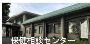
保健相談センター