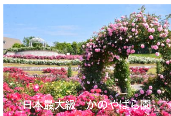
日本最大級 かのやばら園