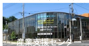
産業支援センター