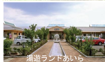
湯遊ランドあいら