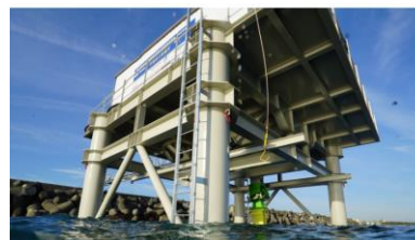
平塚波力発電所（撤去済み）