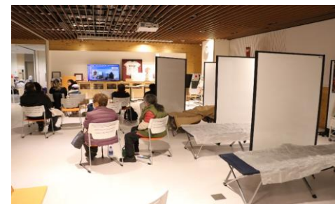
町役場へ避難した住民の受入状況