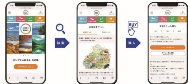
「NIKKO MaaS」サイト利用イメージ