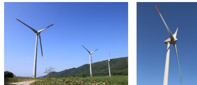
寿都町 風力発電施設