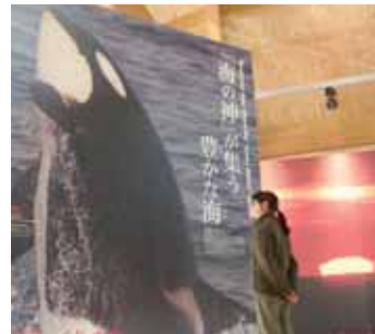
生物實物大小的大照片展示板