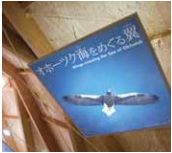
可以感受到木頭溫暖的空間

在知床世界遺產中心中，有以實物大小的照片展示棕熊或蝦夷鹿等棲息在知床的動物，還有棕熊的爪痕等動物所留痕跡的模型。讓大家在享受知床美好的大自然的同時，瞭解必須遵守的規則與禮貌。另外，也公佈知床世界遺產的景點或大自然的即時資訊，且同時提供管理知床世界遺產的最新資訊。