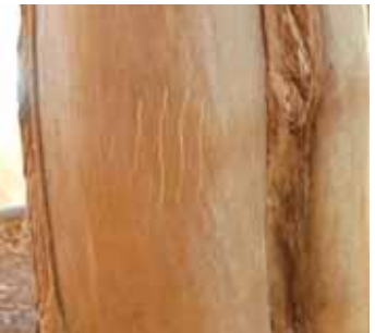
動物所留痕跡的模型（棕熊的爪痕等）