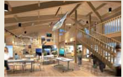
展示在知床岬操縱海洋 獨木舟者或旅行所使用的 的道具等