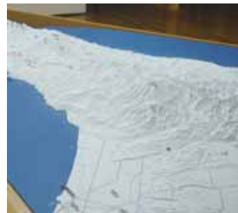
以 1/25,000 的縮小地形模型 介紹知床的景點