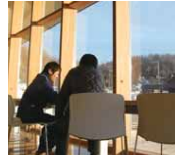
一邊可以閱讀有關知床的書籍等， 一邊可以輕鬆小憩的休息區