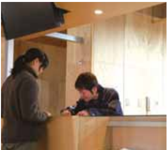
可以瞭解當季自然資訊的資訊導覽處