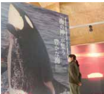
生物实物大小的大型照片壁板