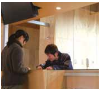
可以了解当季自然信息的信息处