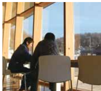
一边可以阅读有关知床的书籍等,一边可以轻松休息的休息区