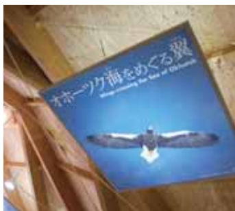
可以感受到木头温暖的空间

在知床世界遗产中心中,有以实物大小的照片展示棕熊或虾夷鹿等栖息在知床的动物,还有棕熊的爪痕等动物所留痕迹的模型。让大家在享受知床美好的大自然的同时,了解必须遵守的规则与礼貌。另外,也公布知床世界遗产的景点或大自然的即时信息,且同时提供管理知床世界遗产的最新信息。