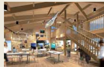
展示在知床岬操纵海洋皮艇者或巡回山麓游览所使用的道具等