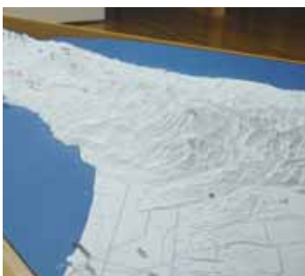
以1/25,000的缩小地形模型介绍知床的景点