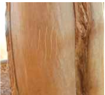
动物所留痕迹的模型(棕熊的爪痕等)