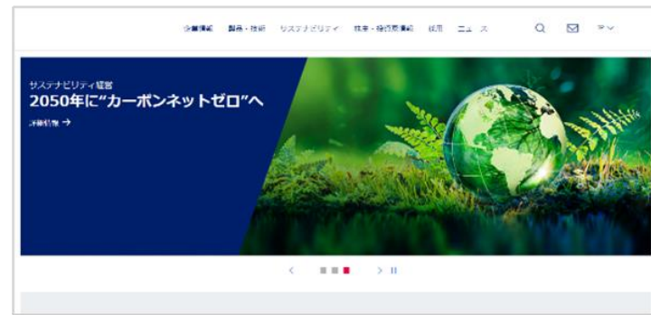
(B) 環境に配慮した取り組みをTOPページに掲げている企業