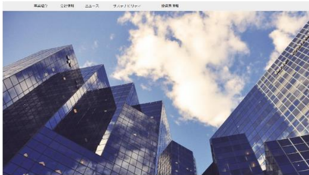
(A) 事業紹介をTOPページに掲げている企業