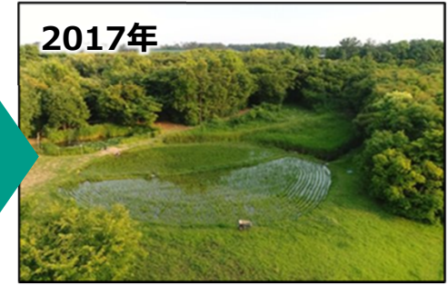
生態系の創出の取組例（静岡県富士市）