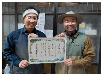
自然共生サイト認定証授与式（令和5年10月25日）