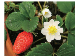
新宿御苑で作出された国産 苺第一号の「福羽イチゴ」

園内には、明治時代にデザインされた風景式庭園、整形式庭園、日本庭園をはじめ、江戸屋敷の名残を残す玉藻池、里山のような豊かな生態系が見られる母と子の森などがあります。