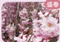
盛春 ヤエベニシダレ