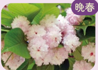
晩春 ケンロクエンキクザクラ