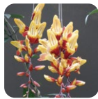
ツンベルギア・ マイソレンシス