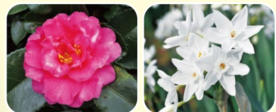
①カンツバキ ②スイセン'ペーパーホワイト'