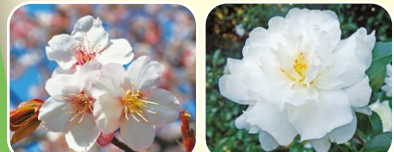
⑤カンザクラ類 ⑥サザンカ