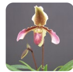
パフィオペディルム シンジュク #144