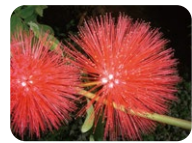
オオベニゴウカン