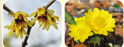
③ロウバイ類 ④フクジュソウ