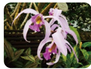
レリオカトレア シンジュク #190