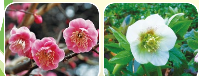
⑦ウメ ⑧クリスマスローズ