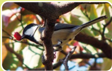
ハナミズキの実をくわえた シジュウカラ

「実りの秋」というように、秋は多くの植物の実ができる季節です。新宿御苑でもハナミズキやムラサキシキブ、マテバシイなどさまざまな果実が熟します。果実は都会で暮らす生きものたちにとって大切な食糧や住みかにもなり、生きものたちの命を支えています。秋の園内で生きものと果実のつながりを感じてみませんか。