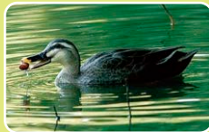
ドングリを食べる カルガモ