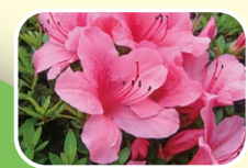
8 皋月杜鹃 5月 6月 7月