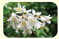
7 齿叶溲疏 5月 6月 7月