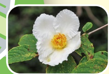
10 夏山茶 5月 6月 7月