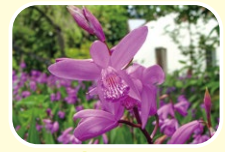
3 白及 5月 6月 7月