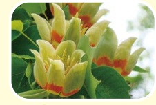
2 北美鹅掌楸 5月 6月 7月