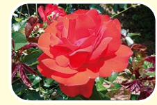
4 蔷薇 5月 6月 7月