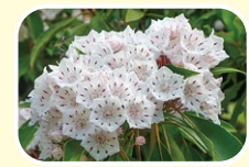
6 山月桂 5月 6月 7月