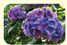
11 绣球 5月 6月 7月