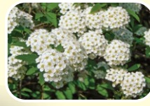
1 麻葉繡球 5月 6月 7月