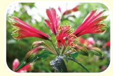
5 鸚鵡六出花 5月 6月 7月