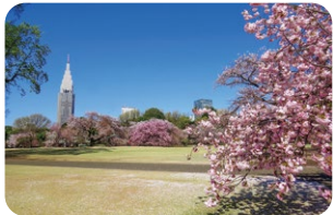
영국 풍경식 정원

신주쿠교엔에는 일찍 꽃을 피우는 벚나무부터 늦게 피는것까지 70종류 약 900그루에 달하는 벚나무가 있습니다.그중에서도 가장 인기 있는 벚꽃 명소를 소개합니다.