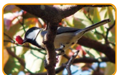
衔着山茱萸果实的 远东山雀

秋天是许多植物结果的季节。新宿御苑也将迎来山茱萸、日本紫珠、日本石柯等各种果实的成熟。这些果实也是生活在城市中的生物们的重要食物和住所,支撑着它们的生命。