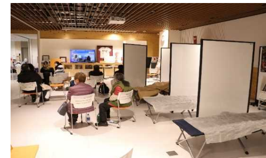
町役場へ避難した住民の受入状況