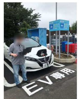
顧客向けEVパワーステーション