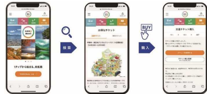
「NIKKO MaaS」サイト利用イメージ