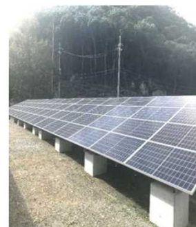
設置した太陽光パネル