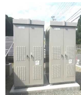
パワーコンディショナー